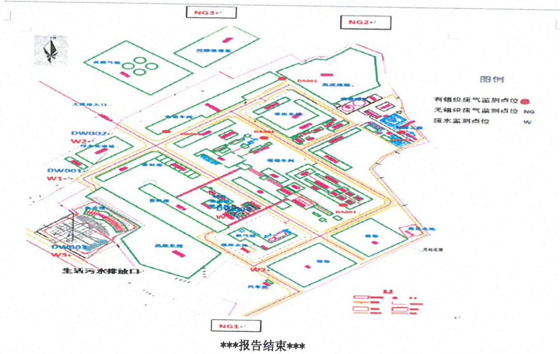
附图二：监测点位示意图