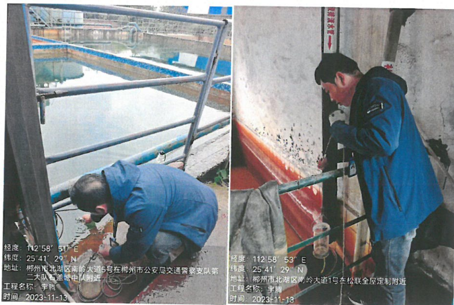
附图一：现场采样照片