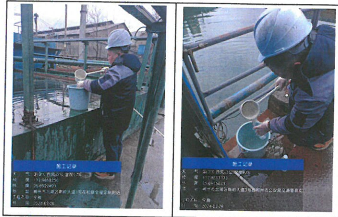
附图一：现场采样照片